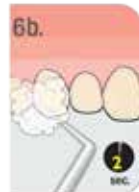
6b. 2-SEKUNDOWY DELIKATNY STRUMIEN POWIETRZA NA KAŻDY ZĄB