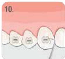
10. USUNĄĆ NADMIAR KLEJU