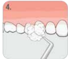
4. WYSUSZYĆ. DOBRZE WYTRAWIONE SZKLIWO POWINNO BYĆ JAK KREDA