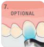
7. WSTĘPNIE NASWIETLIĆ (OPCJONALNIE)