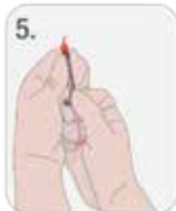
5. NAŁOŻYĆ ŚCIŚLE KONCÓWKĘ OPAL SEAL