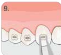
9. PRZYKLEIĆ ZAMEK